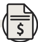
Réception de la facture