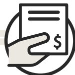
Réception du reçu