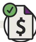
Réception du paiement