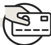
Payez votre prestataire