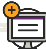
Demande de paiement