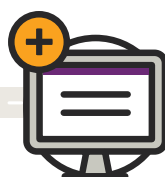
Demande de paiement