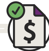
Réception du paiement

Si vous en avez les moyens avec vos budgets d'aides autogérés, vous pouvez utiliser une partie de votre financement NDIS pour obtenir des conseils et de l'aide de professionnels afin de configurer et gérer votre budget de plan NDIS et payer vos prestataires. Lorsque vous ne pouvez pas utiliser le portail myplace, un formulaire de demande de paiement est disponible.